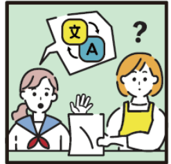
日本語が第一言語でない家族や障がいのある家族のために通訳をしている。