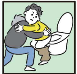
障がいや病気のある家族の入浴やトイレの介助をしている。

ヤングケアラーの支援については 市区町村の「こども家庭センター」 又は児童福祉担当部署までご連絡ください