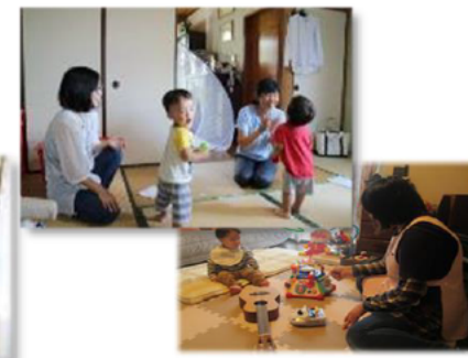
育児支援のイメージ